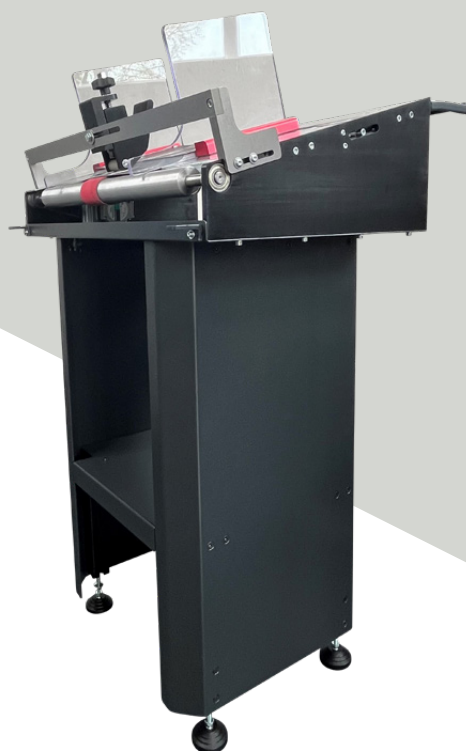
Mettifoglio automatico opzionale

*La reale velocità di produzione dipende dal formato, dalla composizione del prodotto, dalla qualità della carta e delle cordonature e dalle condizioni generali del prodotto.